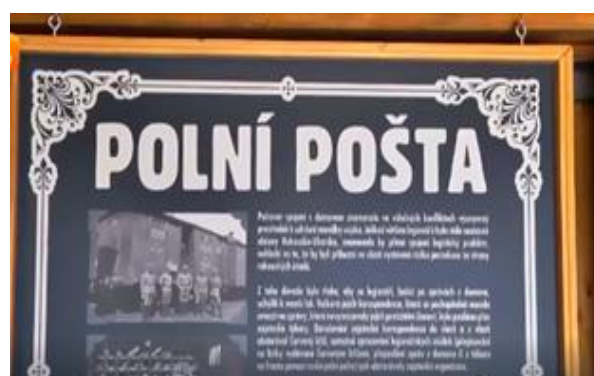
Texta foto M.Piarová